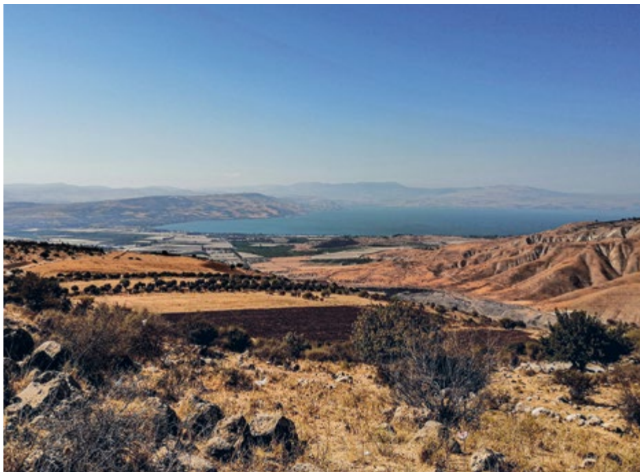
Blick von Gadara auf den See Genezareth

Infos gibt es im Pfarrbüro: pfarramt@ekise.de 07823 - 96550