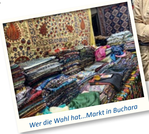
Wer die Wahl hat...Markt in Buchara